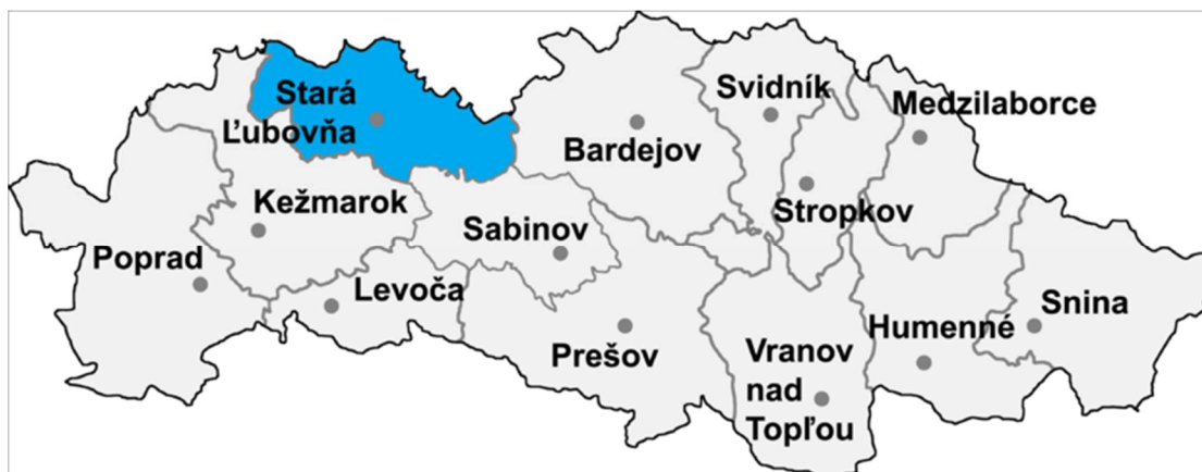
Umiestnenie okresu Stará Ľubovňa v rámci Prešovského kraja (zdroj: sk.wikipedia.org)

Cesty II. triedy: 20,787 km Cesty III. triedy: 138,639 km (zdroj: sk.wikipedia.org)